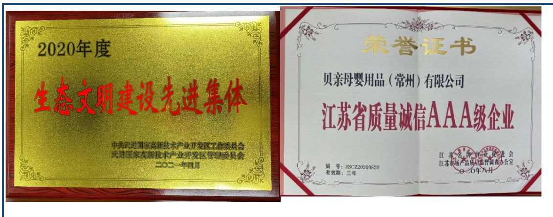
图 1.4-1 公司荣获武进区“生态文明建设先进集体”和江苏省“质量诚信 AAA 级企业”称号